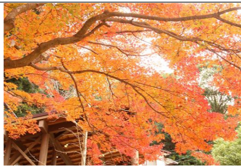
今年も鮮やかに紅葉しました！

新年は卯（うさぎ）年です。「一つの物事が収まり次の物事への移行をしていく段階。また「卯」のうさぎは「茂」という時期であり、繁殖する、増えるという段階にあたる。その両方を備えた「癸卯」は、去年までで様々なことの区切りが付き、次へと向かっていく」年になるそうです。園にも10月にうさぎを迎え入れました。新年は干支である兎が園にいるので、とても心強く感じています。年末の慌ただしさを一掃し、余計なモノは片付けました。新しい一年を迎えることに感謝します。本年も一年間よろしくお願ひいたします。