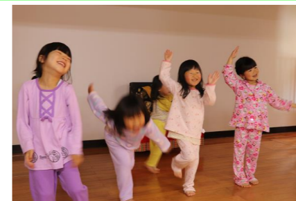
ハイヤ祭りの記憶も鮮明に