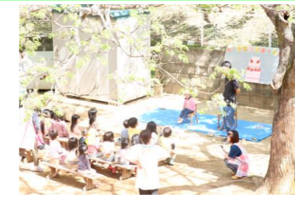
おたんじょう会も園庭で！