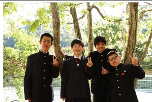
中学校入学おめでとう！

立春から数えて88日目を「八十八夜」といいます。この頃は春と夏の変り目で、気候が暖かく穏やかになり、稲の種まきや茶摘みのシーズンになります。今年度が始まり一か月が経過しました。子どもたちは新しい環境を受け入れ、遊びや生活も少しずつ落ち着き始めました。季節の変わり目や環境の変化は、心身共に大量のエネルギーを消費します。五月病という症状からも分かる通り、頑張りすぎると身体に大きな負荷がかかります。何事もバランスが大切です。休息、食事、睡眠、運動などを意識し、個々のメンテナンスを大切にしたいところです。5月は様々な場所への散歩を楽しみ、これからの遊びにつなげたいと思います。