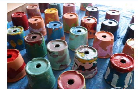
母の日のプレゼントも心を込めて