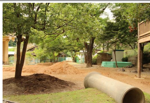
新しい園庭はこちら！

これから台風の季節に入ります。7月の豪雨災害からの二次被害が無いことを祈りながら、万が一備え準備をしているところです。さらに、9月から10月は地区や園の行事も多く、にぎやかな時期ですが、今年は新型コロナの影響で、秋祭り、健康祭、敬老会の慰問など、様々な行事の中止が決定しております。地区行事との関わりも見直し、それに代わる経験も考えようと思います。