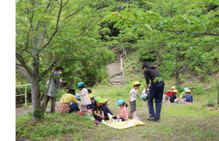
散歩に出かけお弁当を食べました