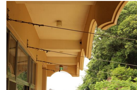
ツバメの巣は合計7個出来ました