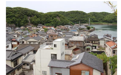
茂串のお寺の跡地からの眺め

5月も散歩を重ね、春を楽しみました。ゆっくりとした時間は、新しい発見ができます。一日一日を喜び、積み重ねることが後の成長につながります。春の発見は夏の遊びの拡がりにつながります。今年の春は十分発見できたのではないのでしょうか？