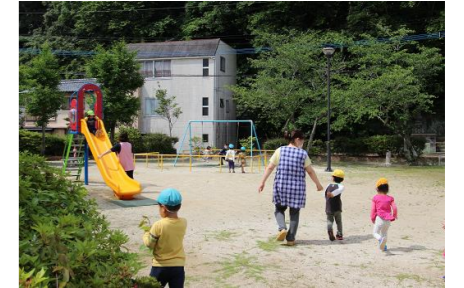
茂串の公園に寄り道