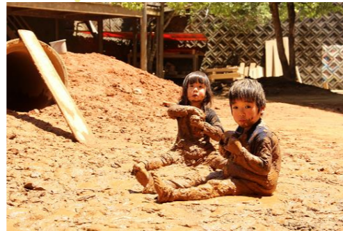
おひるごはんも忘れ、没頭していました

園も活動が限られる中で、散歩を重ね、落ち着いた生活を過ごさせています。4月から梅雨に入るまでの時期は、遊びの「発見～拡がり」の時期ですが、すでに拡がりが見られます。落ち着いて生活が出来ている分、遊びの展開も充実しているように感じます。十分に情感体験を重ねた経験は、生活の基礎となります。発見は遊びが深まる初めの段階です。この経験が生かされるよう、6月の室内遊びの工夫を行いたいと思います。