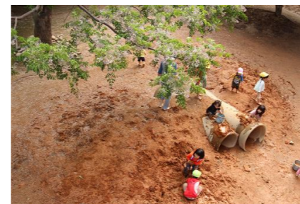
せんだんの木の花びらが雪のように