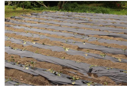
秋に向けて芋苗を植えました

5月も散歩を重ね、春を楽しみました。ゆっくりとした時間は、新しい発見ができます。一日一日を喜び、積み重ねることが後の成長につながります。春の発見は夏の遊びの拡がりにつながります。今年の春は十分発見できたのではないのでしょうか？