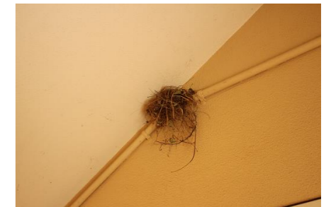
今年はスズメも巣を作りました