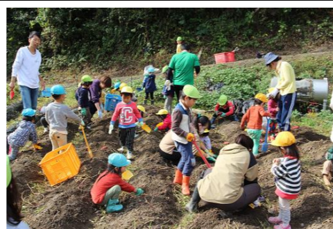
たくさん収穫できました！

「春風秋雨」春風が吹いて秋の雨が降るまでの長い月日のこと 先日、新型コロナのリスクレベル1が発表されました。今年もコロナと共に様々な出来事があり長い月日を過ごしましたが、あっという間の出来事でした。監査も終わり、仕事もひと段落したので、年末の大掃除のタイミングで書類整理を行い、身も心も軽くしたいと考えています。7日大雪、22日冬至。季節は冬を迎えます。先日収穫したサツマイモが数年ぶりの豊作で、心配された病気の被害もほとんどありませんでした。豊かな実りは、豊かな生活を与えてくれます。柿は干してドライフルーツに。芋は焼き芋や干し芋にしてみんなで食します。また新年を迎えられることがありがたいことですね。