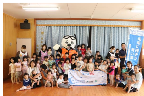
海上保安庁の安全教室

先月、保育園留学で初めて、外国からの受け入れがありました。日本語が話せない環境で、子ども達は様々な方法でコミュニケーションを取っていました。園と家庭もアプリを活用し連絡を取りました。国外との交流は、世界の広さを実感し、視野を広げ、多くの刺激になりました。その場を楽しめる子ども達の姿に、私達も考えさせられる2週間でした。今年の夏は、昨年よりも多くの保育園留学の受け入れを予定しています。園児だけでなく、園にとっても貴重な機会となります。この経験が将来につながるように取り組みたいと思います。